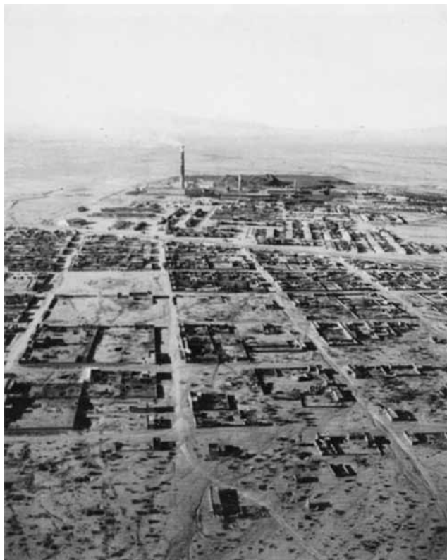
Figura 1. Toma aérea de Ranchería Juárez y Ávalos en 1954.

Las particularidades educativas que presentó una comunidad campesina donde la mayor parte de sus habitantes contaban con grados de escolarización muy escasos, despertaron el interés de un grupo de investigadores pertenecientes al Cuerpo Académico 111 de Historia e Historiografía de la Educación –adscrito a la Universidad Autónoma de Chihuahua– para dar cuenta de los procesos educativos que ocurrieron en la ranchería. Establecieron como propósito final la publicación de resultados de la investigación a través de un libro impreso, en el que tuvieran la posibilidad de dar a conocer el surgimiento y desarrollo de los planteles educativos, para luego incorporar el texto a las actividades escolares dentro de la asignatura de Historia, en cinco escuelas de la colonia Villa Juárez.