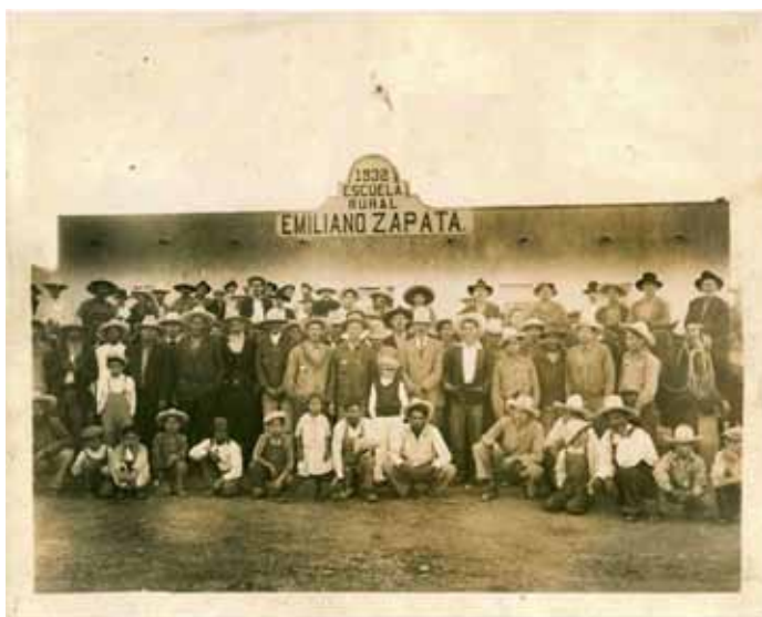
Figura 2. Habitantes del ejido Ranchería Juárez en la ceremonia de inauguración de la escuela primaria Emiliano Zapata en 1932.