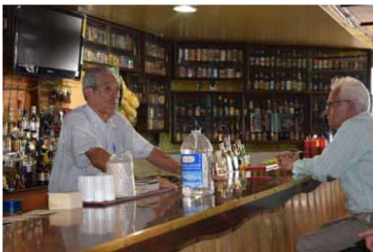
Figura 3. El proceso de investigación con actores de la comunidad de Ranchería Juárez.