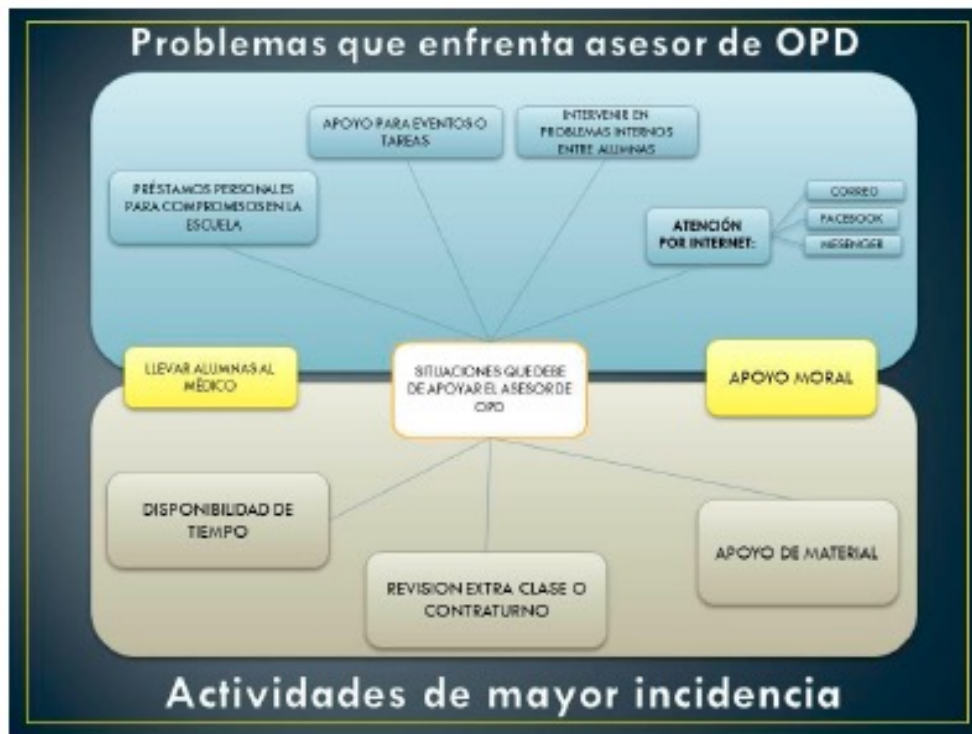
Figura 1. Problemas y actividades del asesor.