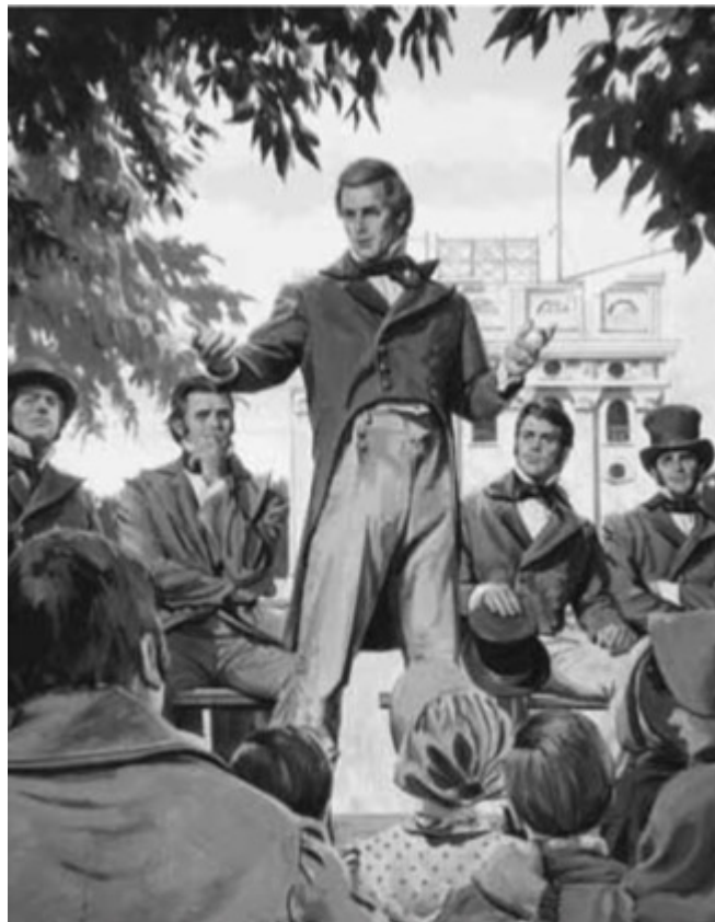
Figura 1. Joseph Smith evangelizando (LDS, 2007, pág. 576).

Bajo esta misma táctica continuaron durante varios años, enviando a miembros de la iglesia para establecer poblados en diversos lugares, tal como sucedió en 1835 cuando los misioneros a pesar de las dificultades físicas, económicas y sociales, lograron construir un templo y una imprenta, compraron y cultivaron un área