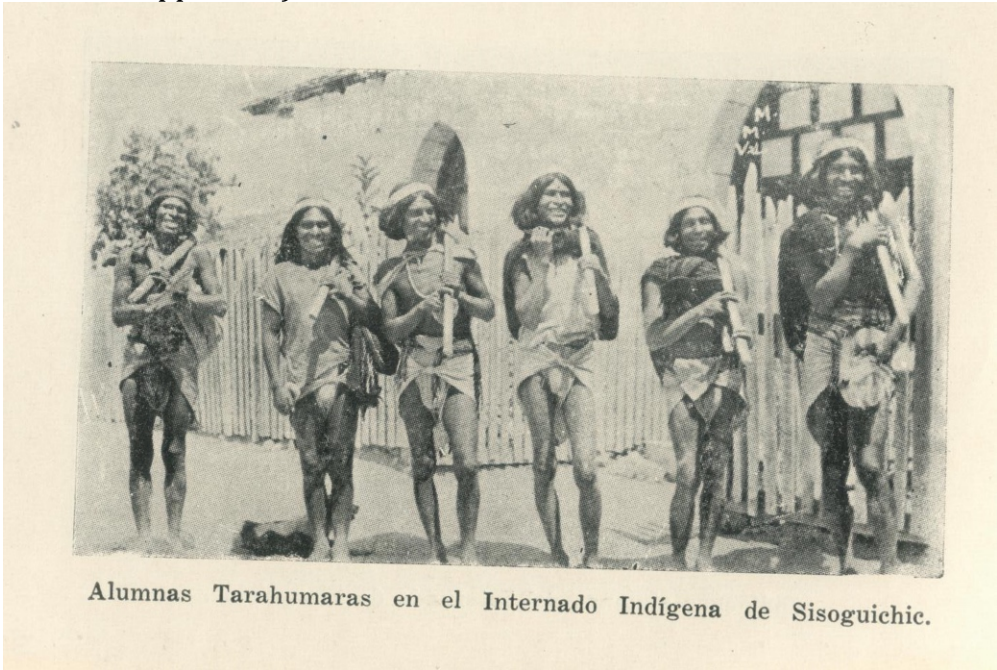
Imagen 5. Tarahumaras. Internado Indígena en Sisoguichic.

año del Gobierno del general RODRIGO M: QUEVEDO en Chihuahua, 1936, pp.82-84).