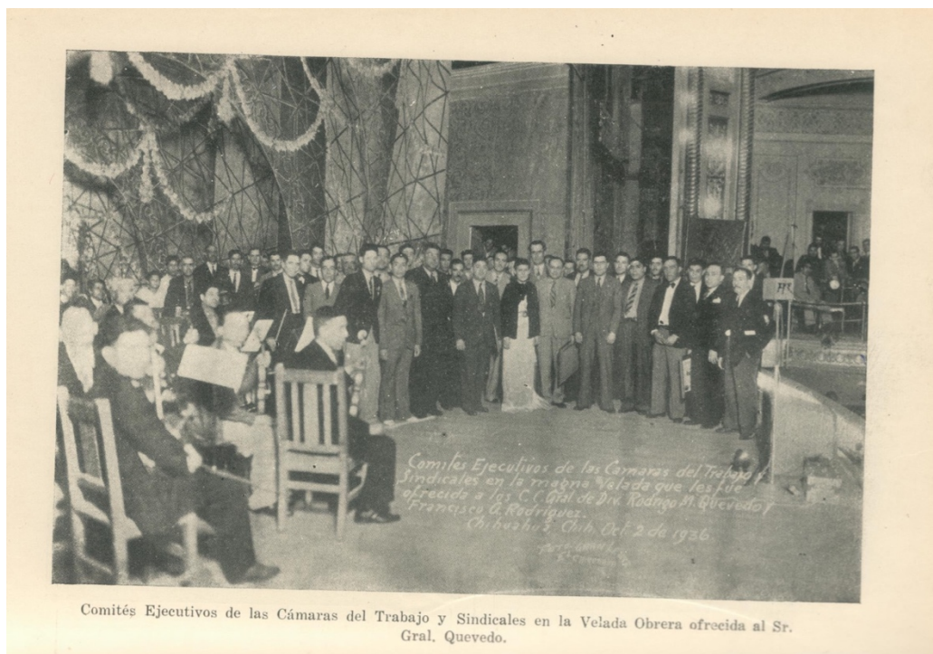
Imagen 7. Cámara de Trabajo y sindicales. Velada obrera.