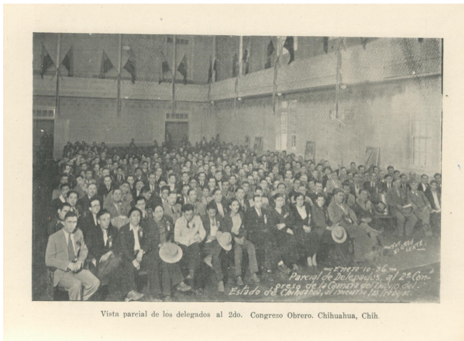
Imagen 6. Segundo Congreso Obrero. Chihuahua, Chih.