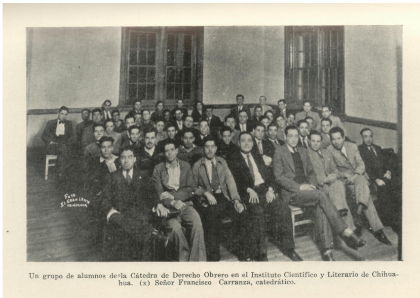
Imagen 4. Cátedra de Derecho Obrero. Instituto Científico y Literario de Chihuahua. Fuente: Último año del Gobierno del General RODRIGO M. Quevedo en Chihuahua (1936).

El informe inicia con un resumen de las palabras que dirigió Emilio Portes Gil en la apertura de las actividades del Congreso Agrario, realizado en Chihuahua entre el 7 y 8 de diciembre 1935. En el ámbito de la política del presidente Cárdenas, que entre muchas otras cosas implicaba el uso de la ideología socialista, se aprecia que en el discurso incluyen reiteradamente las palabras socialismo, proletariado, obreros, entre otras. Como ejemplo se pueden citar las siguientes frases: “Cuando la clase obrera y todas las clases proletarias de la Republica estén identificadas con sus gobernantes, podrá decirse que los programas sociales, económicos y políticos, están de antemano resueltos” (Último año del Gobierno del general RODRIGO M: QUEVEDO en Chihuahua, 1936, p. 28).