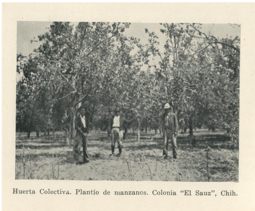
Imagen 3. Huerta colectiva. El Sauz, Chihuahua.

En 1935 por decreto presidencial se creó la Confederación Nacional Campesina que agrupó agricultores, colonos, manufactureros y ejidatarios en todo país. El 7 y 8 de diciembre del mismo año se efectuó en Teatro de los Héroes en la ciudad de Chihuahua el Congreso Agrario donde participó Emilio Portes Gil, entonces presidente del Comité Ejecutivo del Partido Nacional Revolucionario (Archivo Histórico Estatal del Partido Revolucionario Institucional [PRI], s/f).