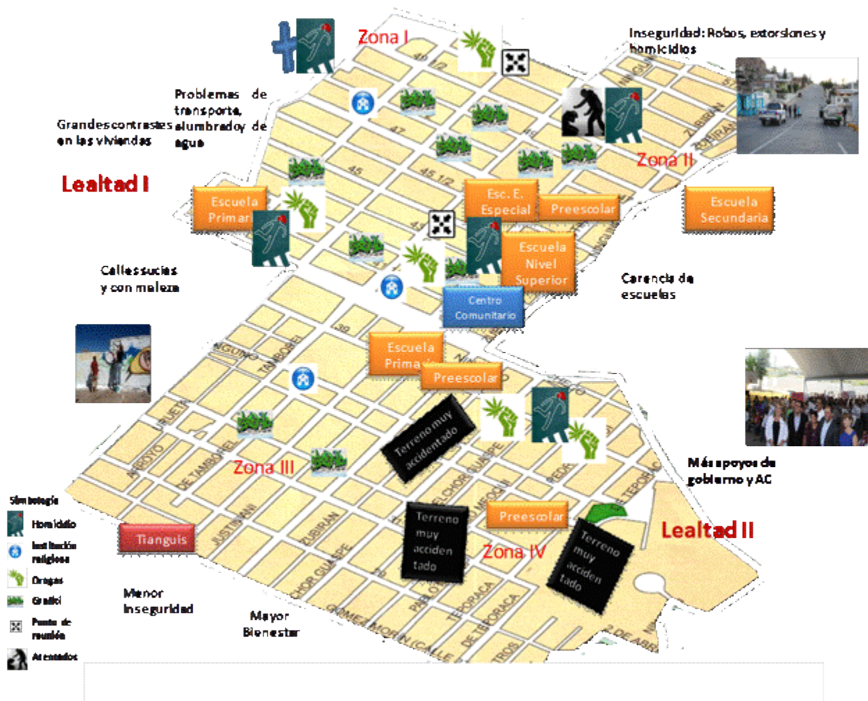
Figura 2 Croquis situado del contexto del estudio

La fotoelicitación es una herramienta de la etnografía visual (antropología visual) que se apoya en imágenes como mediador para producir evocaciones de un determinado informante (Harper, 2002), son entrevistas basadas en la fotografía u otra fuente de imágenes que se muestran a los sujetos para identificar percepciones sobre un asunto de interés. En el estudio se llevó a cabo mientras se realizaba el recorrido exploratorio, conforme se iban sacando fotografías de la comunidad se aprovechaban como recurso y fuente para conversar con los vecinos sobre situaciones relevantes identificadas.