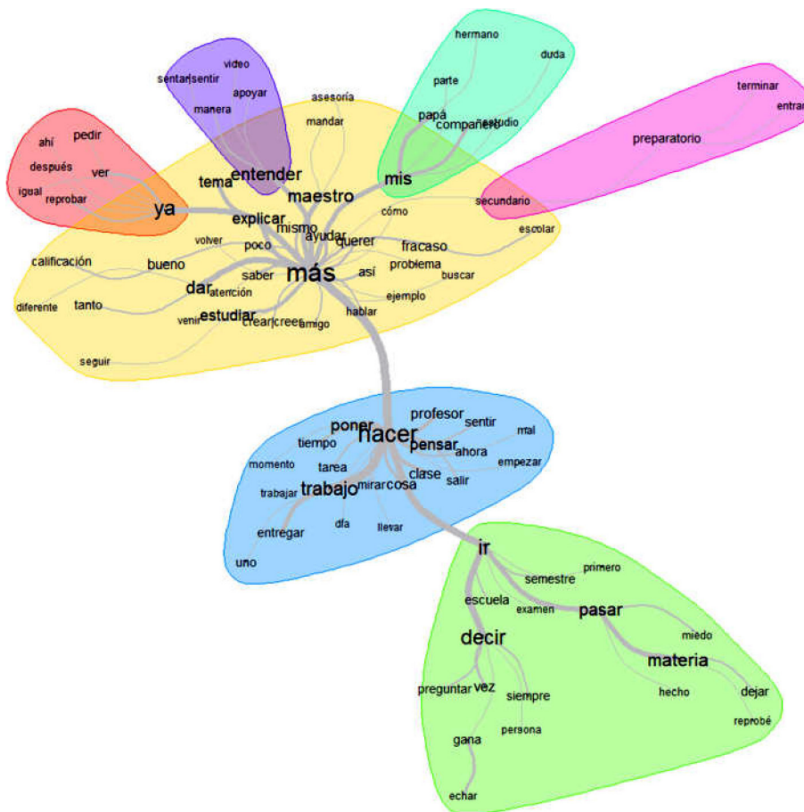
Figura 3. Gráfica de ramificaciones de palabras a partir del análisis de similitud.